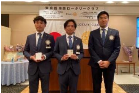
(左から橋幹事、継岩前年度幹事、大星パスト会長)