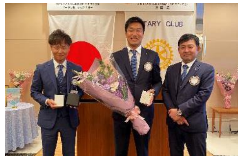
(左から三橋会長、大星パスト会長、西野パスト会長)