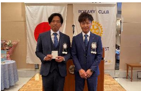
(左から継岩副会長、三橋前年度副会長)